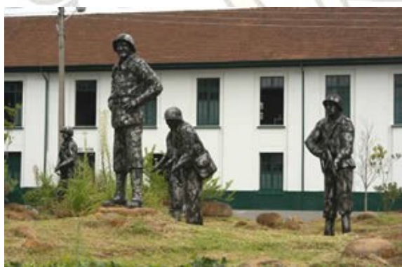
Monumento Patrulha Sargento Max Wolff Filho